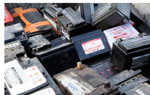
Piles et accumulateurs au plomb