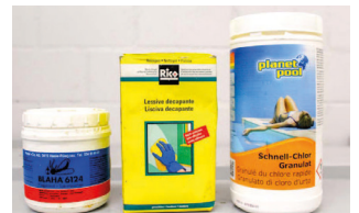
Produits chimiques solides