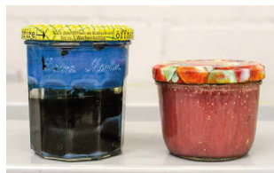
Déchets solides non identifiables