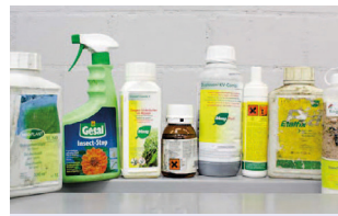
Phytochimiques (pesticides) liquides