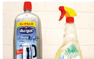
Produits chimiques liquides