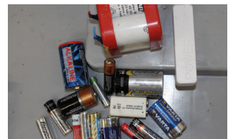
Piles et accumulateurs mélangés