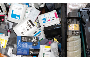
Déchets de toner d'impression