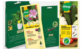
Phytochimiques (pesticides) solides