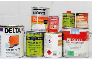
Peintures avec solvant