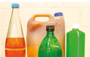
Déchets liquides non identifiables