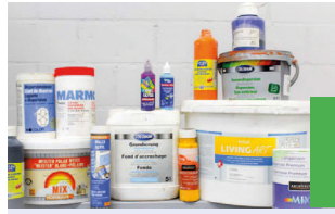
Peintures sans solvant